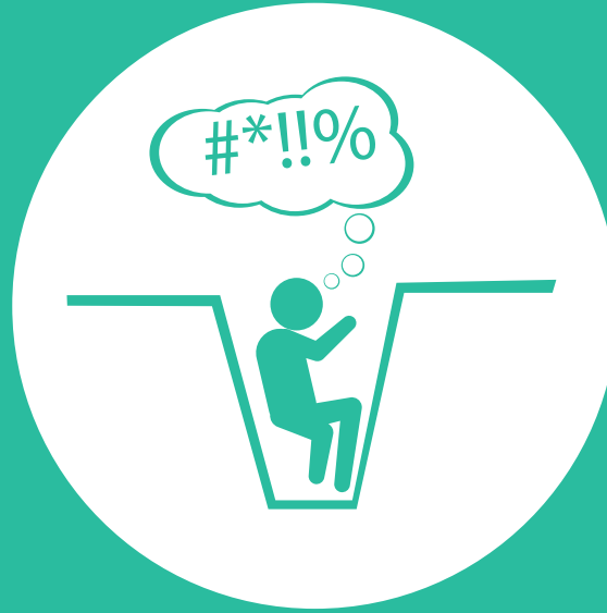
Falta de habilidades para la vida que generen empoderamiento