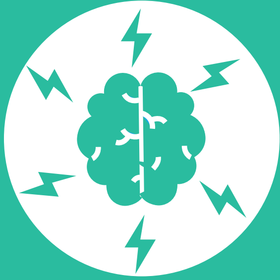
Diagnóstico psiquiátricos y neurológicos