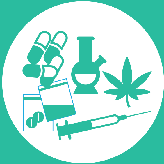
Consumir sustancias psicoactivas