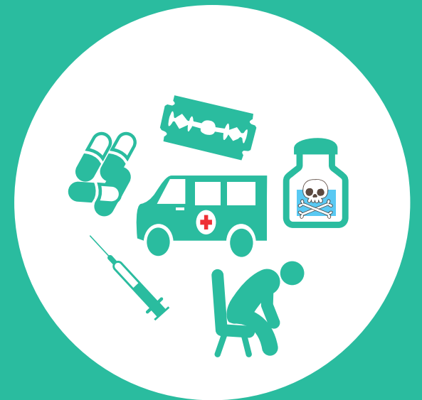
Sensación de soledad e intentos previos de suicidio