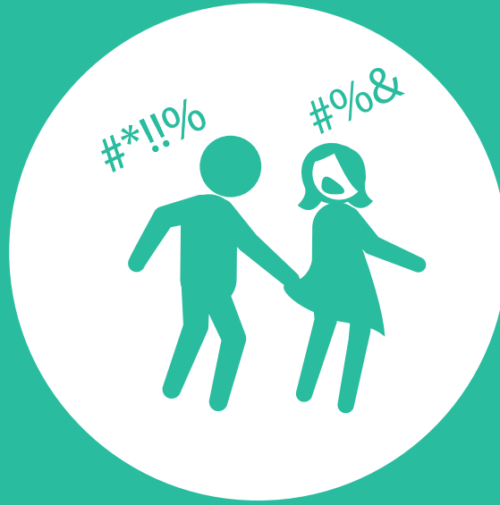
Ser víctima de cualquier tipo de violencia